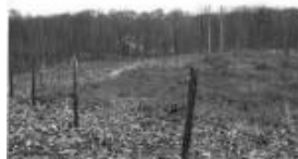
Parcelle 43 en 1996(JPEG, 396.8 ko)