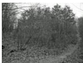
Parcelle 43 en 2007(JPEG, 746.7 ko)