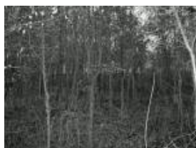
Parcelle 43 en 2007(JPEG, 756.4 ko)