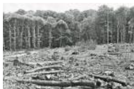
Parcelle 43 en 1993(JPEG, 726.3 ko)

Seule une conversion en futaie irrégulière, dans toutes les parcelles où subsistent encore les derniers arbres centenaires, redonnera à Saint Cucufa un visage de vraie forêt.