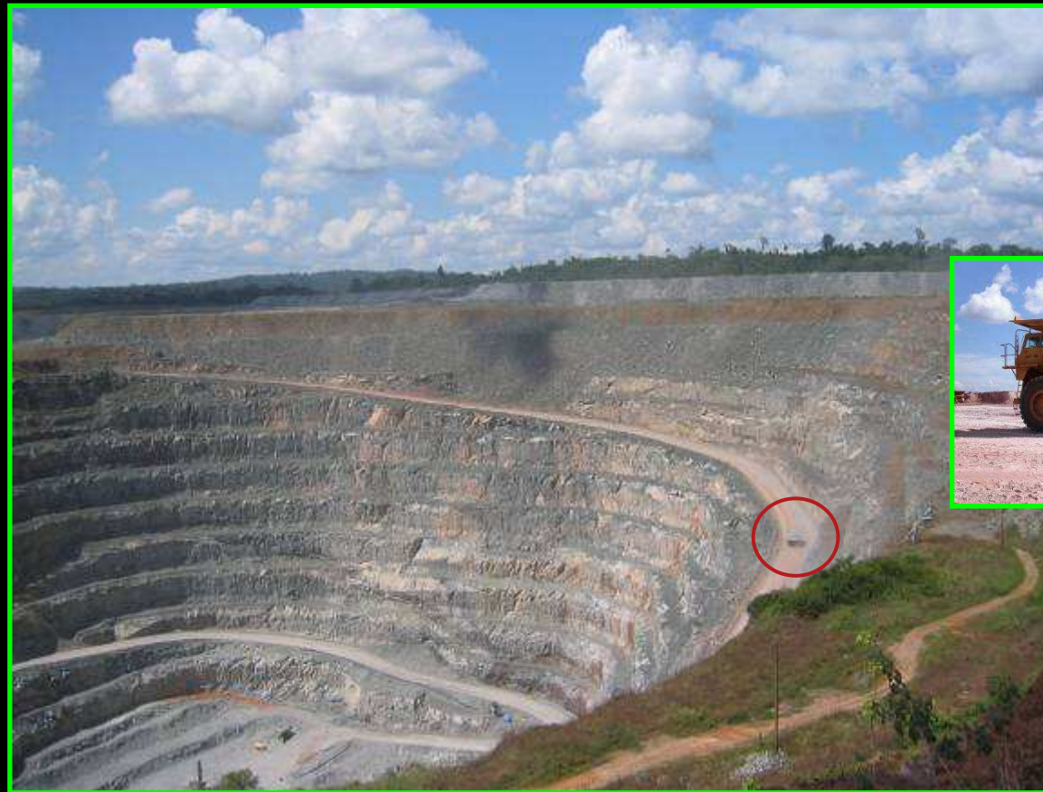
Mines d'Omaï au Guyana exploitée par Cambior CBJ-Caïman

D es fosses de 150 mètres de profondeur vont être creusées. Sur la durée du projet (7 ans) plus de 12 millions de tonnes de roches seront broyées et mélangées à 30.000 tonnes de produits chimiques (cyanure: 3990 t ; chaux : 21 280 t ...) En plus d'un accident industriel (rupture de digue...), les risques sanitaires peuvent aussi provenir d'une contamination lente et continue des sols, des eaux de surface et souterraines par les substances extraites du sous-sol ( métaux lourds , arsenic... ).